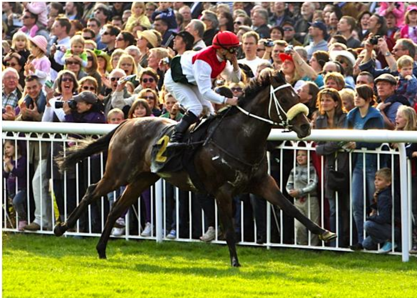
Overdose siegt am 17.04.2011 in Hoppegarten mit Bahnrekord